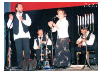
Koncert zespołu Jarmula Band