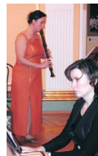
Koncert w Foyer teatru