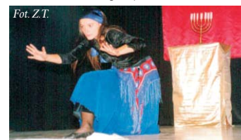
Spektakl pantomimiczno - taneczny