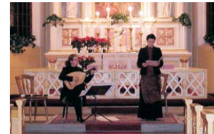
Koncert w kościele ewangelickim „Na Nivach”