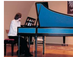
Koncert w nowej sali PSM

Tegoroczna – siódma już – edycja Festiwalu „Muzyka Dawna w Cieszynie” organizowanego przez Cieszyńskie Towarzystwo Muzyczne we współpracy z Ośrodkiem Kultury „Strzelnica” z Cieszkowa została zakończona. Przez tydzień (21-28 listopada 2004) słuchacze mieli szansę obcowania z muzyką dawnych mistrzów, barokowym instrumentarium i wspinałymi kreacjami muzycznymi, realizowanymi przez znakomitych artystów młodego pokolenia z Polski, Czech i Niemiec.