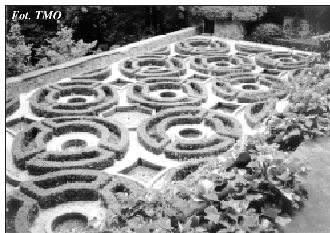
Zdjęcie z wycieczki TMO

Ze wszystkich wyjazdów do ogrodów, oprócz zakupów i niezapomnianych wrażeń, przywozimy wykonane fotografie oraz nagrane kasety video. Wszystkie ujęcia fotograficzne mieszczą się w 12. albumach, na stanie mamy też 47 kaset video.