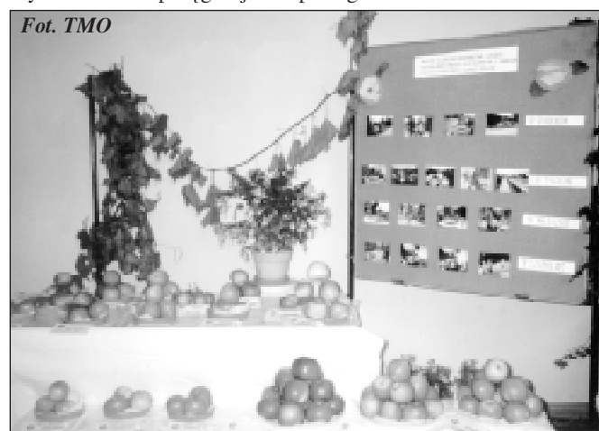
Wystawa z okazji 30-lecia TMO - stoisko z owocami

Łącznie w okresie naszego istnienia nasi członkowie mieli okazję uczestniczyć w 90 wycieczkach. Rocznie planuje i realizuje się 4 – 5 wyjazdów. Bierze w nich udział przeciętnie 49 – 54 osób. W czasie wyjazdów do szkółek specjalistycznych członkowie mają możliwość dokonania zakupów roślin, sadzonek, krzewów itp., a trasa powrotna opracowana jest w taki sposób, by uczestników obarczonych zakupionymi roślinami odwiedzić jak najbliżej swoich domostw. Warty podkreślenia jest fakt, że w odwiedzanych od lat szkółkach spotykamy się z wielką życzliwością właścicieli, służących nam przy tej okazji dobrymi radami nt. pielęgnacji zakupionego materiału.