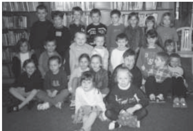
Mali czytelnicy po zajęciach plastycznych

„Opowiadania Babuni” (opowiadanie baśni).