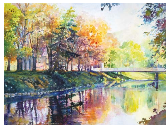
„Olza w Cieszynie – Most Wolności”

Wiadomości Ratuszowe, Biuro Promocji i Informacji, Rynek 1, 43-400 Cieszyn, wr@um.cieszyn.pl