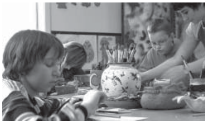
- plastycznej – poniedziałek 16.00 –18.00 (Małgorzata Murzyn)

Osobą odpowiedzialną za ten program jest Małgorzata Murzyn –plastyk. Program obejmuje działalność następujących pracowni artystycznych: