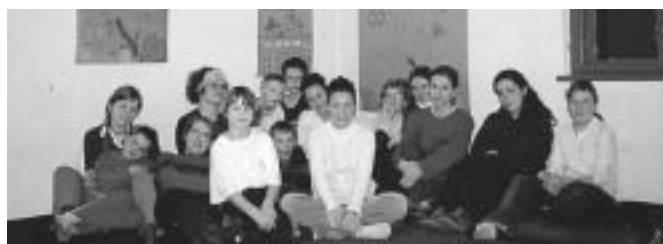
Spotkanie integracyjne uczestników programu „Starszy Brat – Starsza Siostra”

dziecka, wskazywanie mu ciekawych i wartościowych form spędzania wolnego czasu.