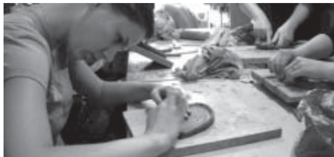
- ceramicznej – czwartek i piątek 16.00 –19.00 (Małgorzata Murzyn)