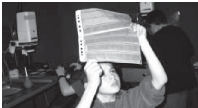
- fotograficznej – poniedziałek 16.00 –20.00 (Artur Solowski) - komputerowej – zajęcia adresowane do dzieci; uczestnicy zdobywają podstawową wiedzę o obsłudze komputera oraz wykorzystują go do twórczej pracy (rozwijanie wyobraźni, gimnastyka mózgu metodą Denisona w wersji graficznej) – poniedziałek, środa 16.00 –18.00 (Agata Roszak)