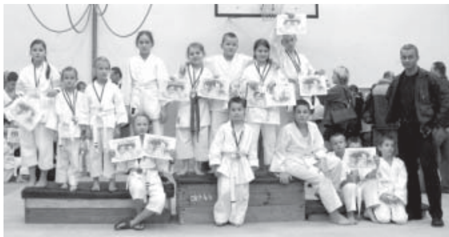
Zawodnicy SHINDO uczestniczący w zawodach w Ostrawie