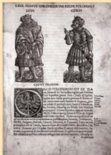
Legendarne postacie Lecha i Czecha (Chronica Polonorum Macieja z Miechowa, Kraków, 1521)

Ilustracje dopełniają dwie sceny historyczne, legendarny wyścig Leszka do korony i koronacja Bolesława Chrobrego. Kronika Miechowity i traktat Decjusza wprowadzają nie znane dotąd formy ilustrowania tematyki historycznej: sceny opowiadające wydarzenia oraz reprezentacyjne wizerunki władcy. Wzory ikonograficzne zawarte w Kronice Miechowity zachowały swą żywotność na przestrzeni całego XVI stulecia. Dwa egzemplarze tego dzieła przechowywane w Książnicy stanowią drugie wydanie (pierwsze ukazało się w 1519 r.). Jeden egzemplarz pochodzi z kolekcji Czytelni Ludowej, drugi zaś połączony z traktatem Decjusza trafił do Książnicy wraz z biblioteką Józefa Ignacego Kraszewskiego.