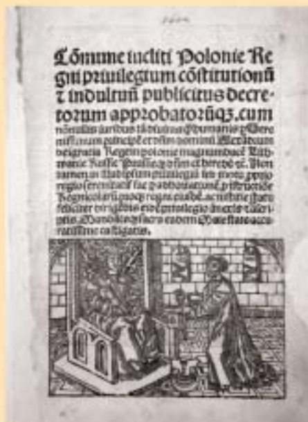
Król Aleksander z kanclerzem Łaskim (J. Łaski, Commune Regni Poloniae privilegium, Kraków, 1506)