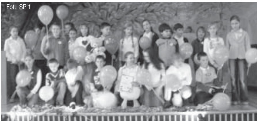
Fot. SP 1